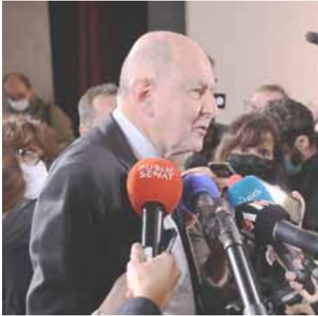
Jean-Marc Sauvé répond à la presse du monde entier.

La cellule se compose de quatre bénévoles laïcs, hommes et femmes, ayant en autres compétences : psychologue clinicienne, médecin, juriste, personnes formées à l'écoute.