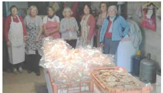
Les « bugneuses » de Larnage.

La vente de bugnes a connu un vif succès comme toujours. L'après-midi a été consacré à des parties de pétanque et à des jeux de cartes, chacun étant heureux de retrouver une certaine convivialité.