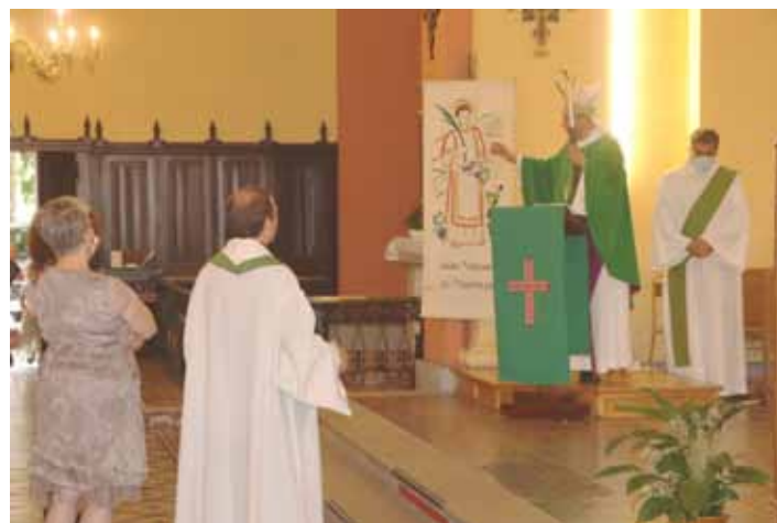
Bénédiction finale : ne faire qu'un autour du Christ