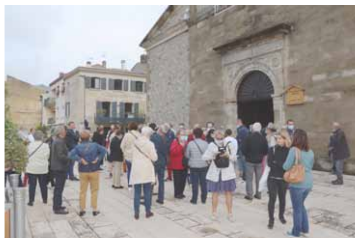
Sur le parvis, l'assemblée attend la sortie de son nouveau curé.

Un apéritif a suivi la messe à la salle Charles Trenet avec le discours de réception du maire de Tain.