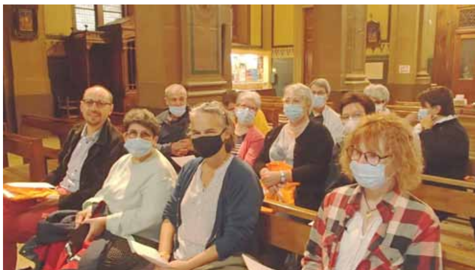
Les participants de notre paroisse.

Début octobre a eu lieu à Lyon un Congrès Mission. Ce fut un rassemblement des chrétiens de toute la Province pour réfléchir à des propositions novatrices pour notre Église. Il y avait entre 2000 et 3000 participants. Voici quelques paroles de la délégation paroissiale qui a participé à l'évènement :