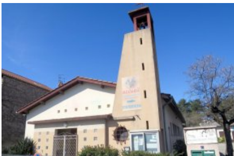
Eglise Saint Pie X à Valence.

Le Conseil aux Affaires Économiques (CAE) s'est réuni le mardi 12 septembre dernier. Il a acté le début des travaux à la Roche de Glun, après la validation du dossier par le diocèse. La paroisse a reçu en legs une maison située à Tain. Nous avons réfléchi aux travaux à réaliser en vue de sa mise en location. Nous avons décidé de changer des vitres dans la sacristie de Veaunes et la sono à Chanos-Curson. Enfin la paroisse participe à hauteur de 5 400 € à la reconstruction de l'Église Saint Pie X située en plein cœur de Valence.